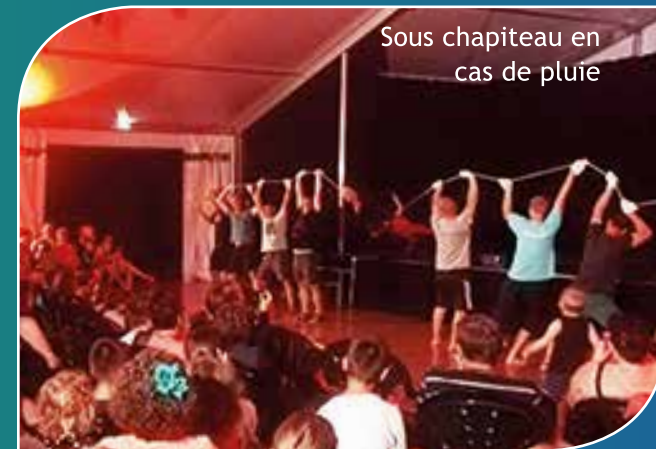
Sous chapiteau en cas de pluie