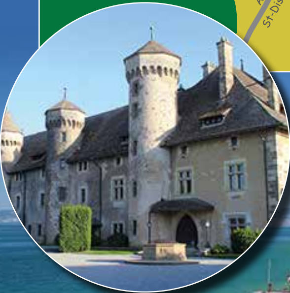
Château de Ripaille