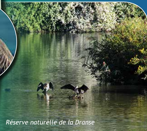
Réserve naturelle de la Dranse