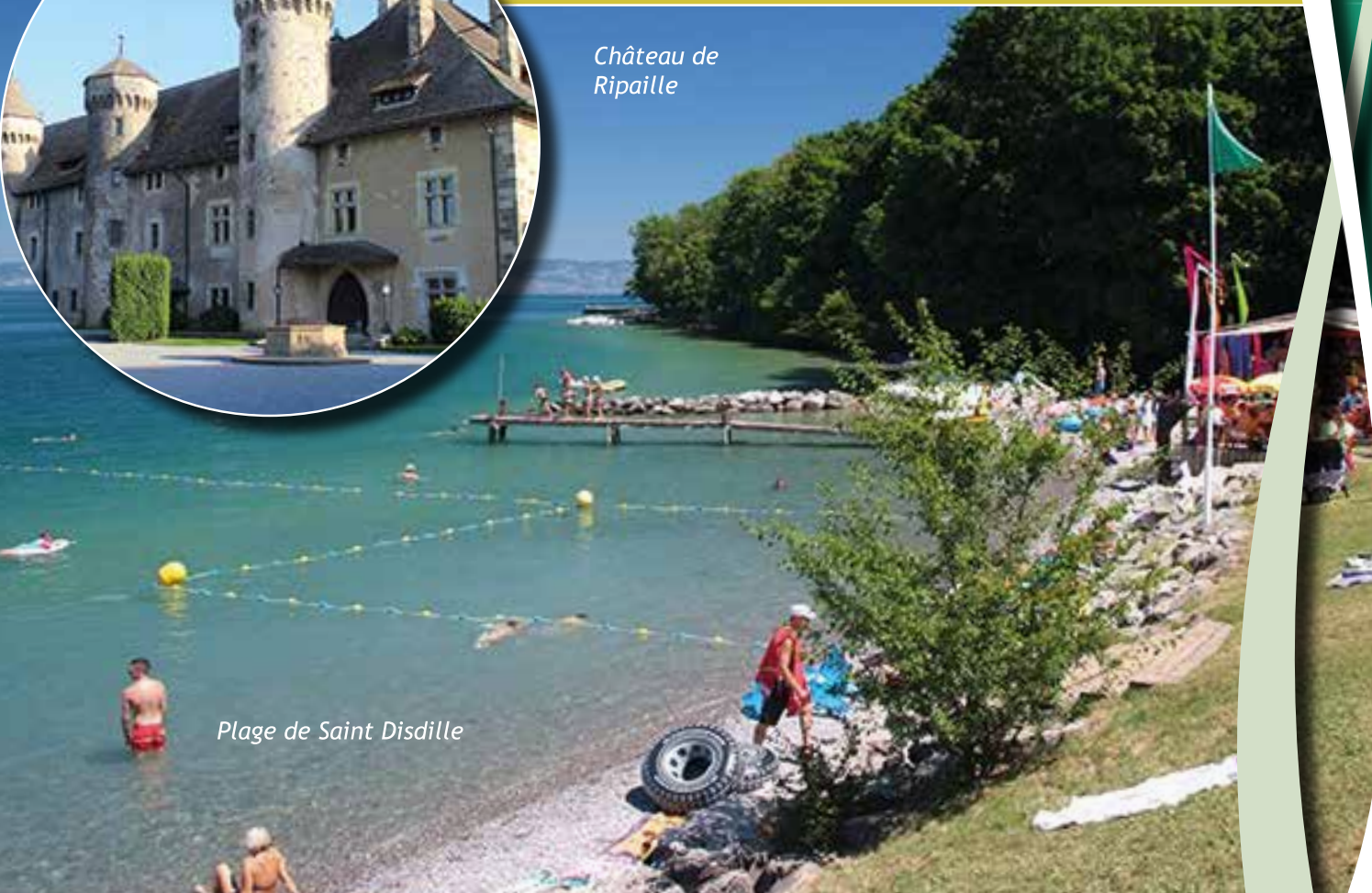
Plage de Saint Disdille